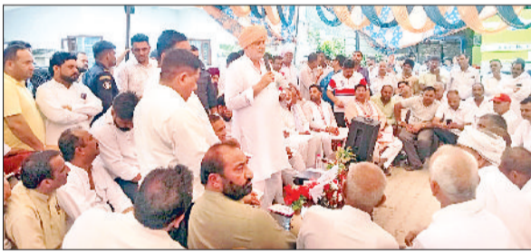
शहजादपुर। लोगों को संबोधित करते कृषि मंत्री श्याम सिंह राणा।