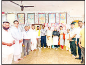
शिविर के दौरान मौजूद संस्था के पदाधिकारी व निगम सदस्य।