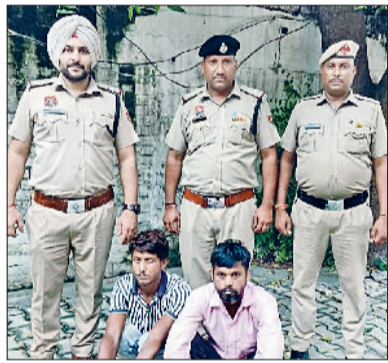
यमुनानगर। कलानौर पुलिस द्वारा प्लेट चोरी करने के मामले में गिरफ्तार किए गए दो व्यक्ति पुलिस हिरासत में बंद हुए।