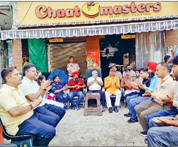
कर लोगों की समस्याएं सुनीं। सेक्टर-13 एक्सटेंशन के निवासियों ने बिजली कटौती और लाइन बदलने की मांग रखी। इस